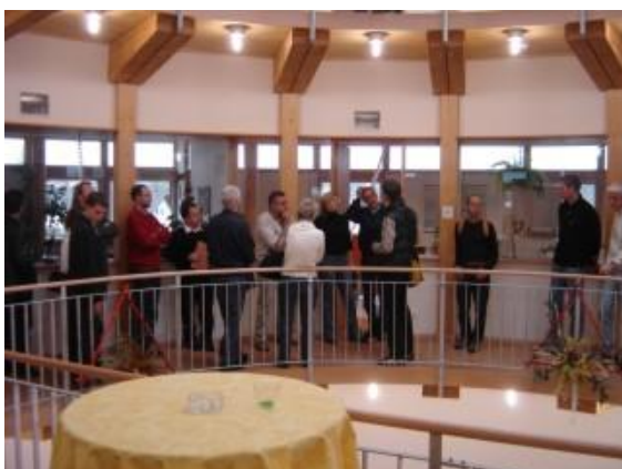
... im Christophorushaus in Stadl Paura