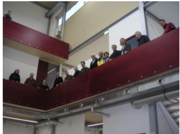
... in der 14m hohen Halle der Orgelwerkstatt