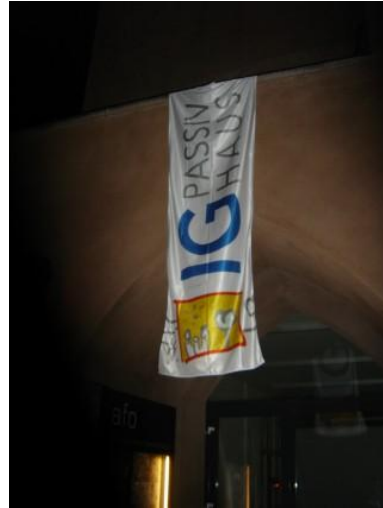
Eingang zum AFO