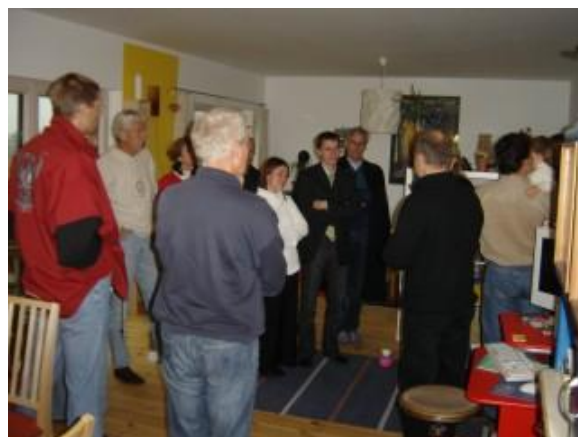
Exkursionsgruppe Salzkammergut im EFH Krautgartner in Gschwandt