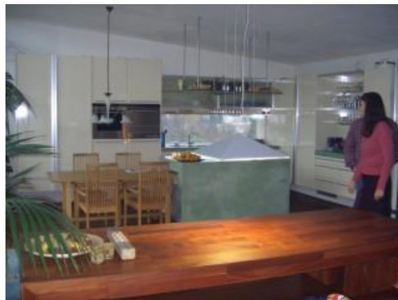
... im EFH Kranawetter in Gallsbach