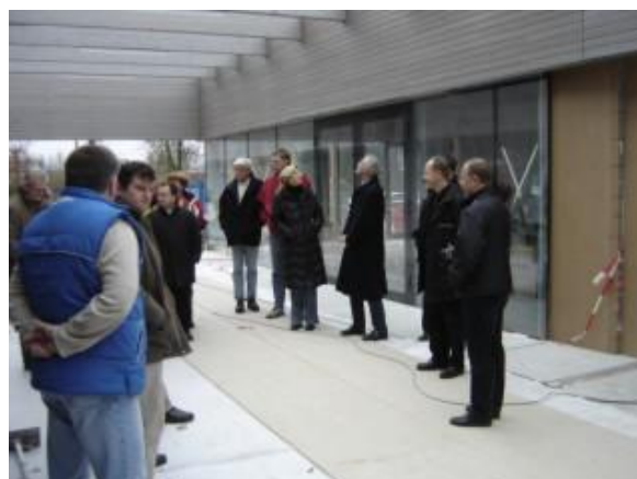
... und in der Piazza von St. Franziskus zwischen Kirche und Pfarrheim