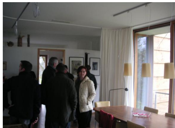
... im EFH Proyer in Steyr