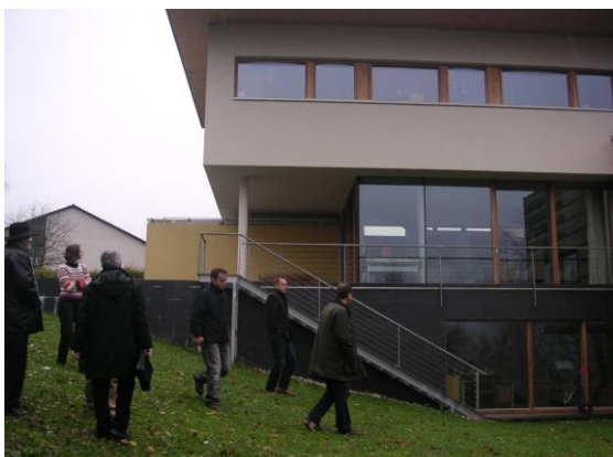
Exkursionsgruppe Steyr vorm EFH Proyer in Steyr