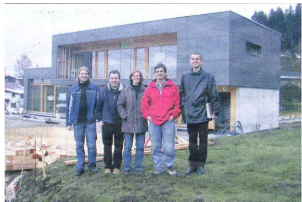
... beim EFH Fink in Bad Häring