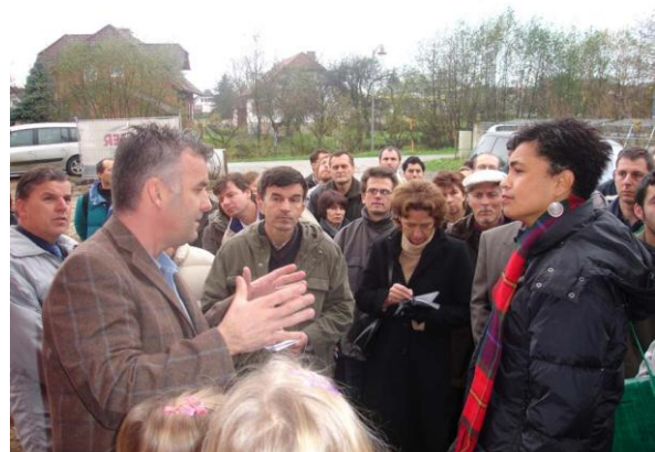
... mit vielen interessierten Fragen