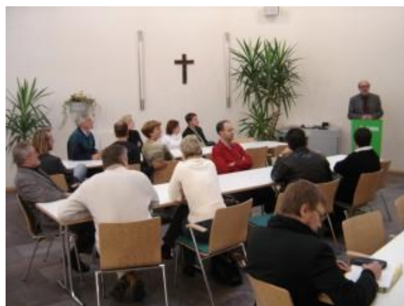
... beim Vortrag im Christophorushaus