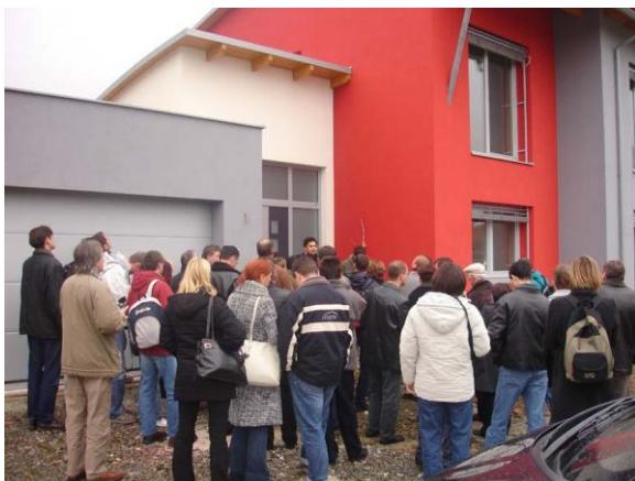
Exkursionsgruppe aus Slowenien in der Steiermark