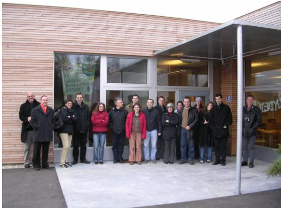
Exkursionsgruppe Niederösterreich Donauraum vor dem Kindergarten in Ziersdorf

Auszugsweise Bilddokumentation der Exkursionen in ganz Österreich am 13.10.04