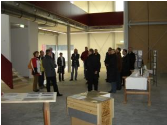
... in der Orgelwerkstatt in Bad Wimsbach