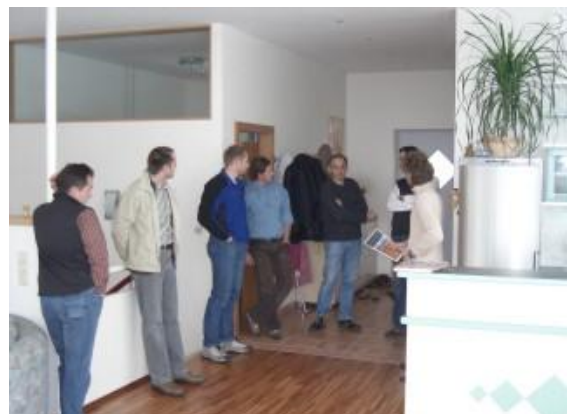
... im EFH Platzer in Hermagor