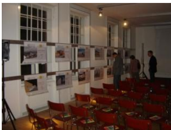
Vorbereitungen für die Abendveranstaltung im AFO, Posterausstellung „1000 Passivhäuser in Österreich“