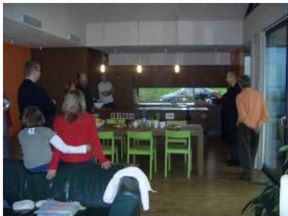
Exkursionsgruppe Inn- und Hausruckviertel im EFH Illibauer in Peuerbach