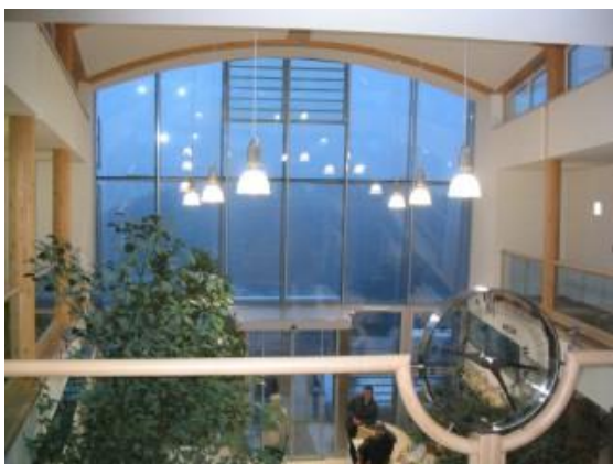
... im Plusenergiehaus Hehenberger in Gutau