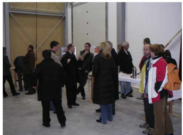
... beim Energietanken