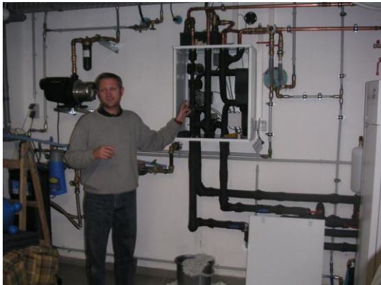
... im EFH Bogner in Steyr