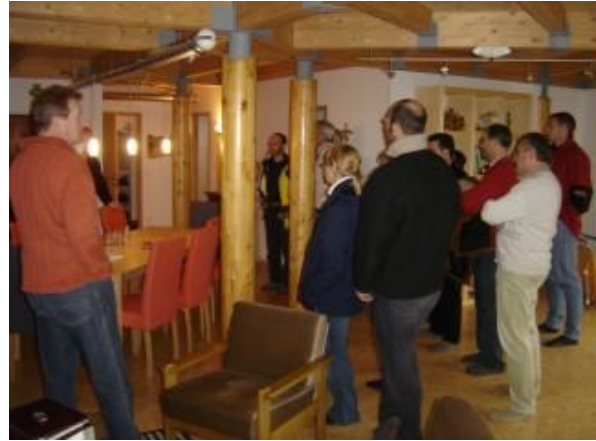
... in der Passivhausscheibe Salzkammergut