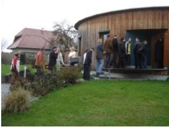
... vor der Passivhausscheibe Salzkammergut