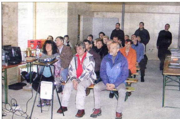
Exkursionsgruppe Tirol beim Vortrag