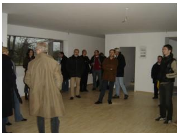
Exkursionsgruppen Salzkammergut und Innviertel im Pfarrheim „Kraftwerk Gottes“ in Wels