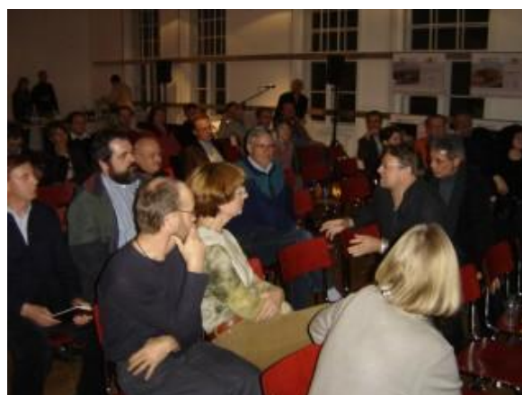
Exkursionsgruppen Steyr, Salzkammergut und Innviertel bei der Abschlussveranstaltung im AFO Architekturforum OÖ