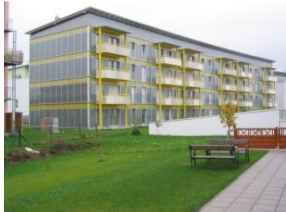
Exkursionsgruppe Mühlviertel in der Solarcity Linz