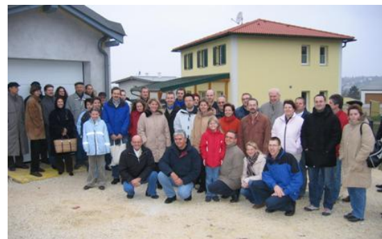
Exkursionsgruppe in Ebendorf vor drei unterschiedlichen EF- Passivhäusern

Im letzten Jahr konnten über 1.300 Besichtigungen registriert werden.