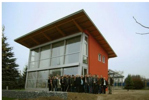
Exkursionsgruppe in Klagenfurt

Außerdem wurden in Österreich insgesamt 7 geführte Exkursionen , sowie 9 Veranstaltungen geboten.