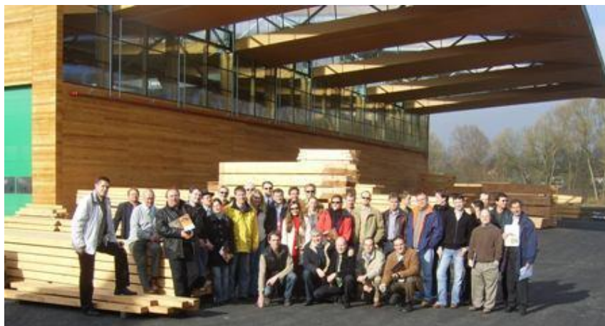
Internationale Exkursionsgruppe vor der Produktionshalle in Passivhausstandard der Fa. Obermayr in Schwanenstadt

Zum ersten Mal wurde diese Aktion auch durch eine internationale Vernetzung samt Informationsaustausch gleich in mehreren Staaten durchgeführt bis in die USA. Weiters waren bei einzelnen österreichischen Exkursionen auch Teilnehmer aus USA, Russland, Litauen, Tschechien, Slowakei, Finnland, Dänemark, Frankreich, Belgien, Deutschland, Italien, Schweiz, Ungarn, Slowenien, Kroatien, Bosnien, Bulgarien und Rumänien einen ganzen Tag dabei.